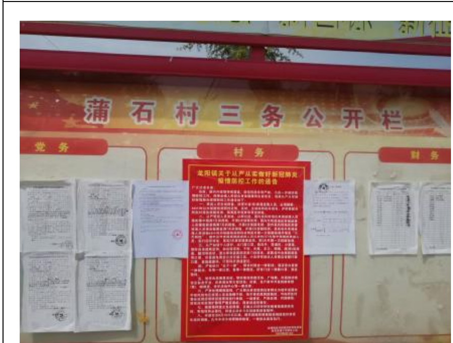
店子村、蒲石村村委会张贴