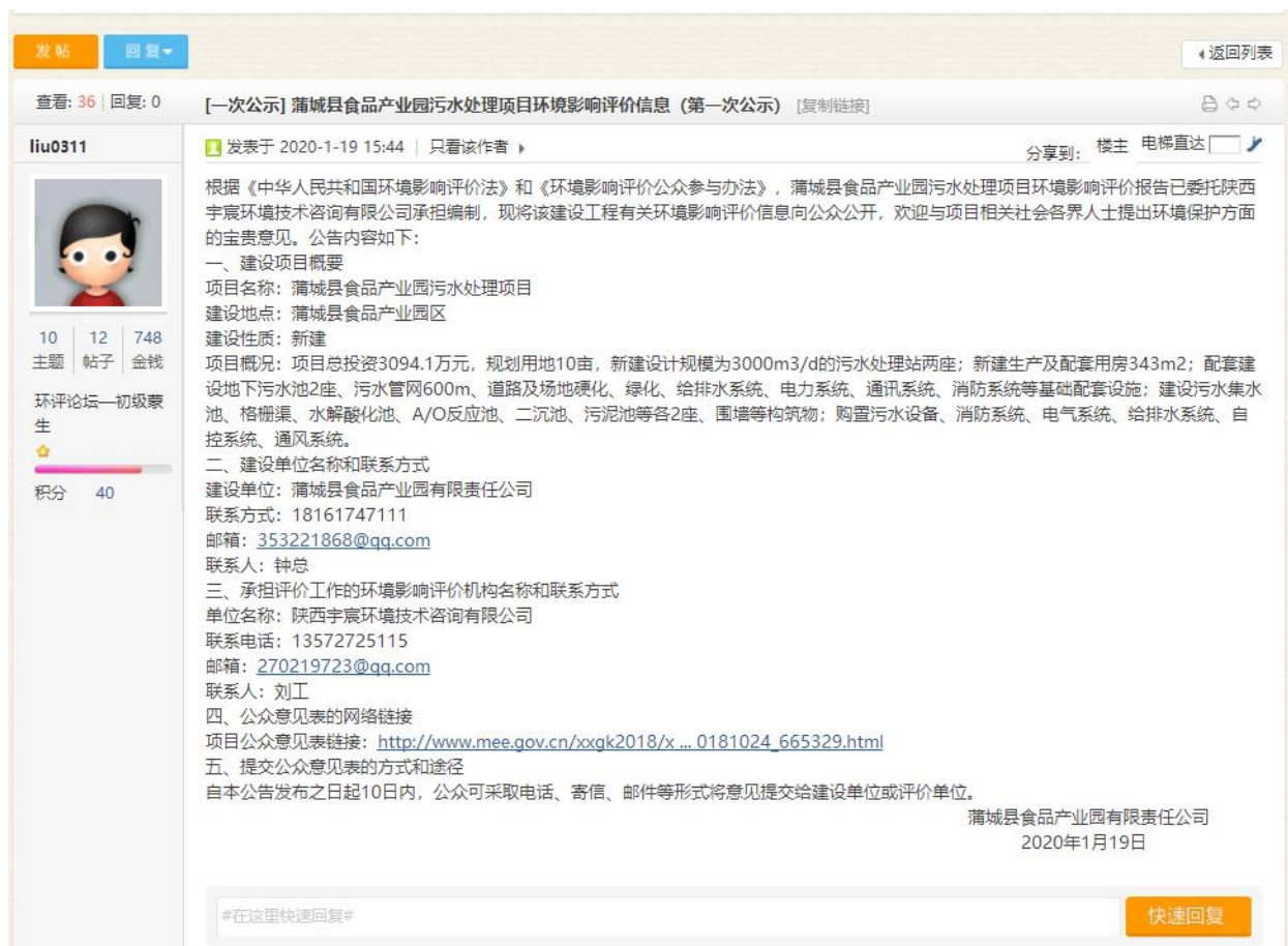
图2 环境影响评价信息第一次网络公示截图