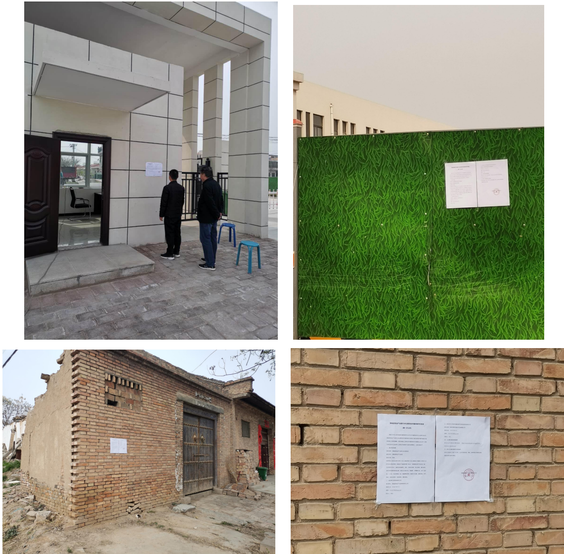
图1 环境影响评价信息第一次公示照片