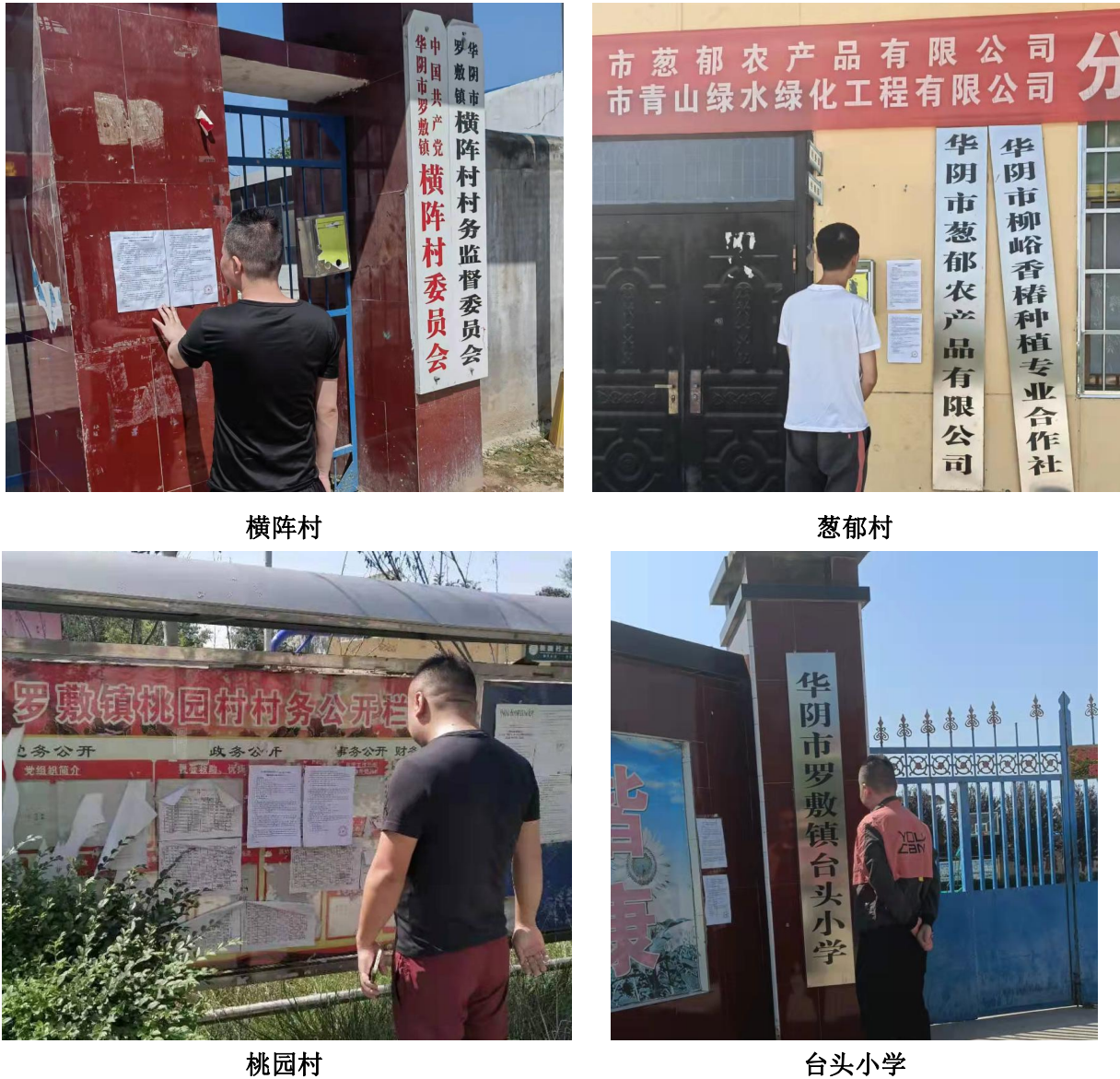
图3.2-4 征求意见稿张贴公示

建设单位于2021年9月6日~9月17日（10个工作日）在项目周围主要敏感目标区域内张贴了《再生塑料循环利用项目环境影响报告书征求意见稿现场公示》，公示时间为10个工作日，符合《环境影响评价公众参与办法》中第十条、第十一条的要求。现场公示照片见图3.2-4。