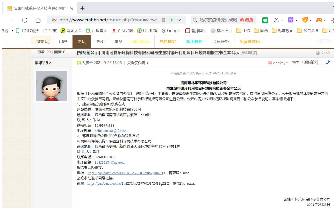
图6-1 报批前（9月23日）公示截图