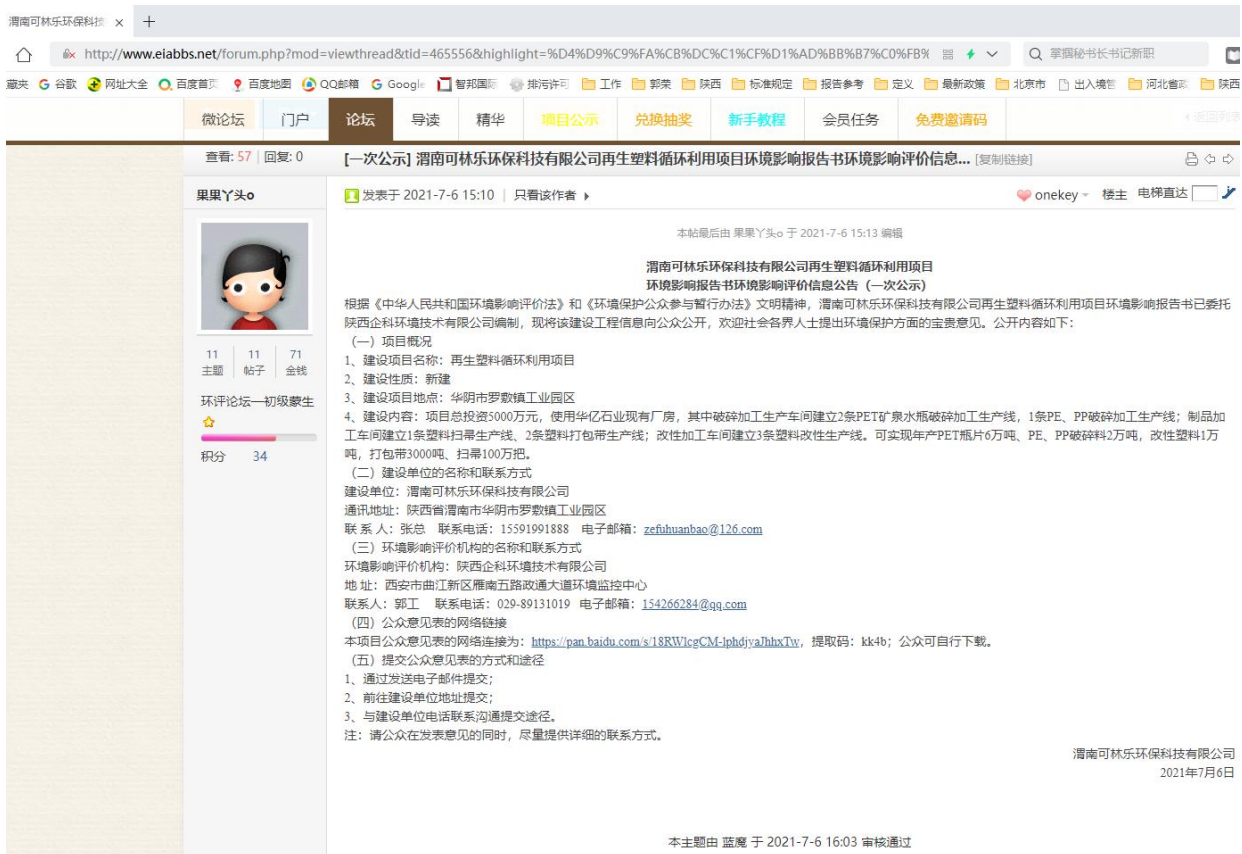
图 2.1-1 网站第一次公示截图