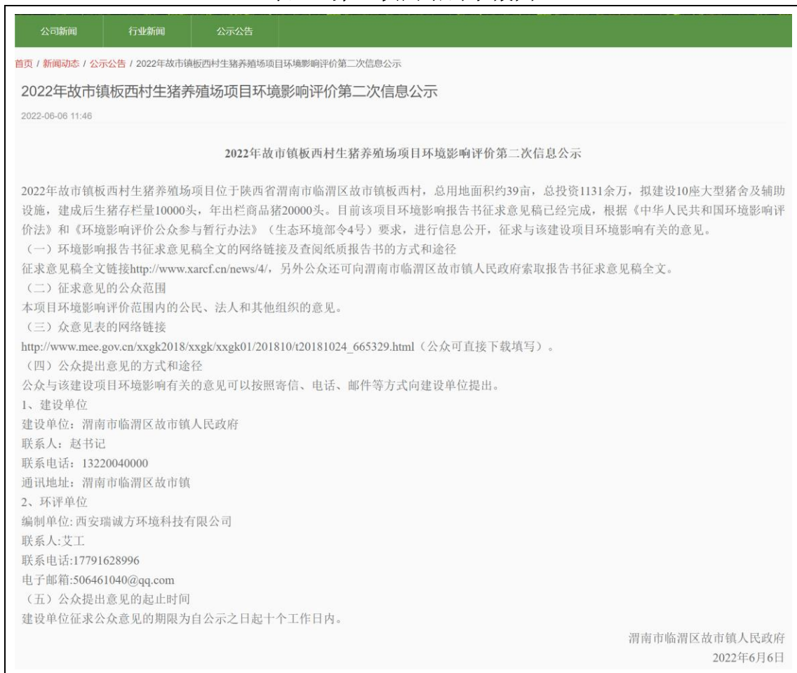
表 5 第二次网络公示截图